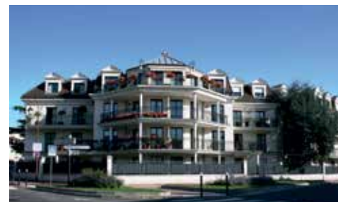
Villa Emilie - ANTONY (92)