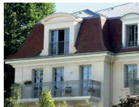
Villa Verdi - LE PLESSIS-ROBINSON (92)