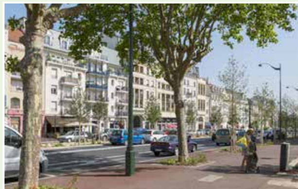
Avenue Charles de Gaulle

“ Le Plessis-Robinson offre un quotidien pratique, convivial et agréable ”