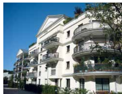
Villa Solène - LE PLESSIS-ROBINSON (92)