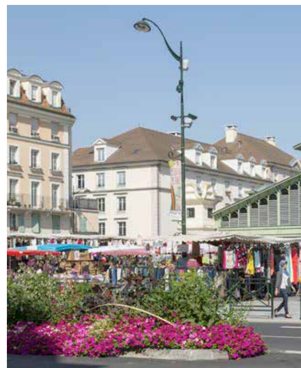
Marché Place du 8 Mai

Parcs, bois, jardins, étangs et rivières dessinent le splendide environnement dont profite le Plessis-Robinson. Ici, où le patrimoine vert couvre plus de la moitié du territoire, espace habité et nature s'entremêlent en un constant et harmonieux dialogue.