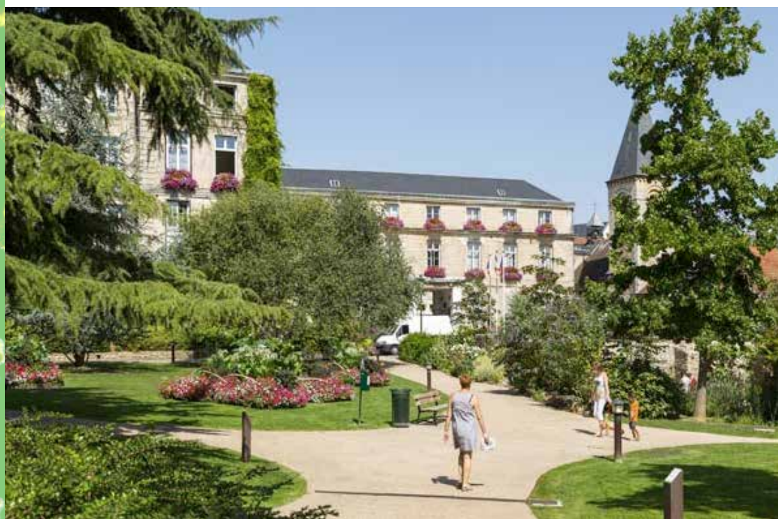
Jardins de l'Hôtel de Ville