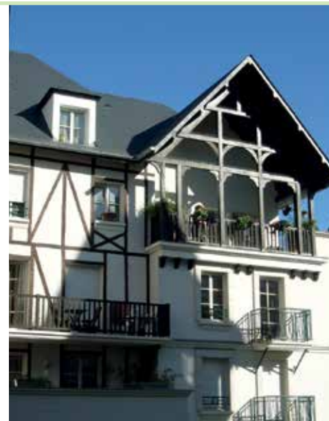
Les Villas Robinson - LE PLESSIS-ROBINSON (92)

Que ce soit pour choisir sa résidence principale confortable et économique ou pour réaliser un investissement patrimonial et financier.